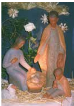
Krippe im Haus La Verna

Mit Franz von Assisi wollen wir das Geheimnis der Menschwerdung tiefer begreifen und in der Gemeinschaft von Gleichgesinnten feiern. Elemente: Gottesdienste, ganzheitliches Feiern, Impulse aus den liturgischen Texten und aus der Spiritualität des Heiligen Franziskus, geschwisterliches Beisammensein.